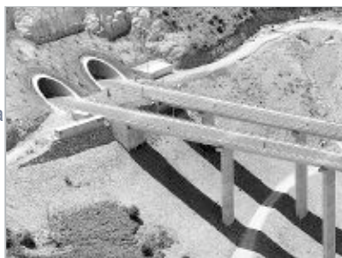
Una de las salidas del túnel de La Grajera donde más suele afectar la niebla. A la derecha, el viaducto de Santiurde.

Apenas lleva un mes abierto y ya se ha convertido en un motivo de preocupación para los que circulan habitualmente por él. En ese corto espacio de tiempo el tramo Pesquera-Reinosa, de la Autovía de la Meseta (A-67), se ha cobrado varios accidentes que han tenido un causante común: la niebla. El mismo día de su inauguración, el pasado día 3, un camión y dos coches chocaban a causa de la escasa visibilidad; el último, el pasado viernes, en una colisión múltiple, se veían implicados 31 vehículos debido a la densa bruma a la salida del túnel.